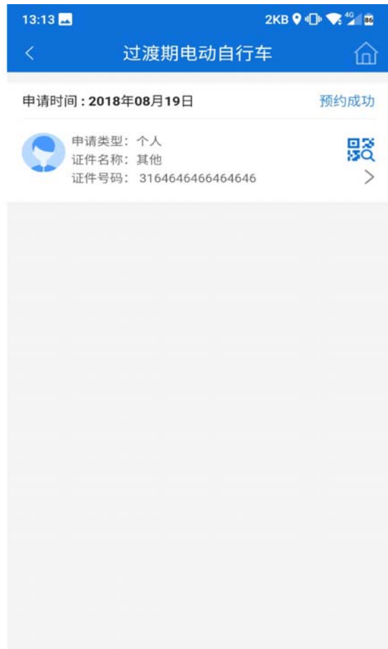
6 预约成功, 至现场出示二维码