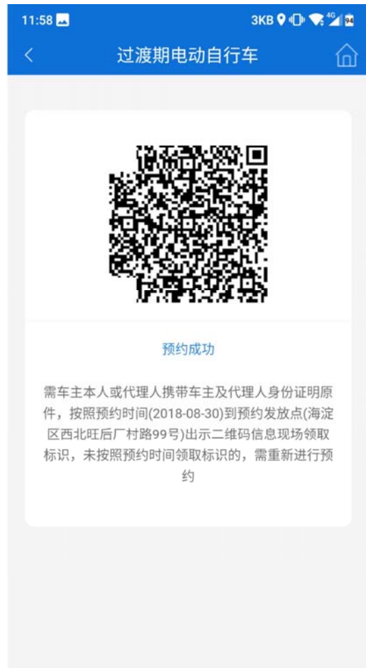
8 至现场出示二维码

“预约办理、现场申领”方式即通过北京交警APP“过渡期电动自行车申请临时标识工作平台”申领临时标识，选择“预约办理、现场申领”预约界面，预约领取临时标识时间和发放点，预约成功后按照预约结果，到办理地点现场提交身份证明并交验车辆后领取临时标识。