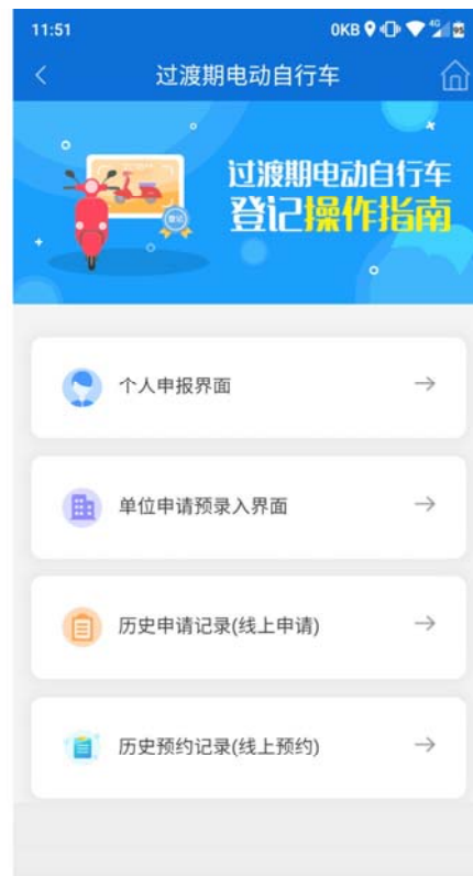
2 点击个人申请或单位申报界面