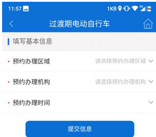
7 选择预约办理时间和地点