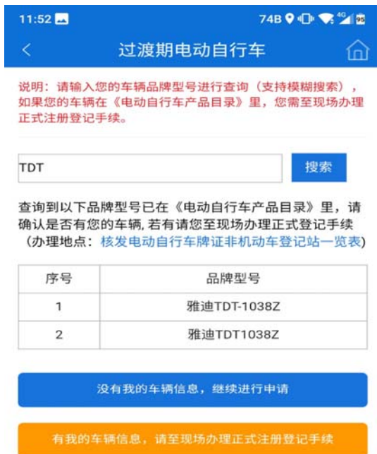
3 输入品牌型号进行查询