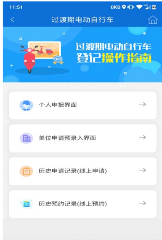
2 点击个人申报界面